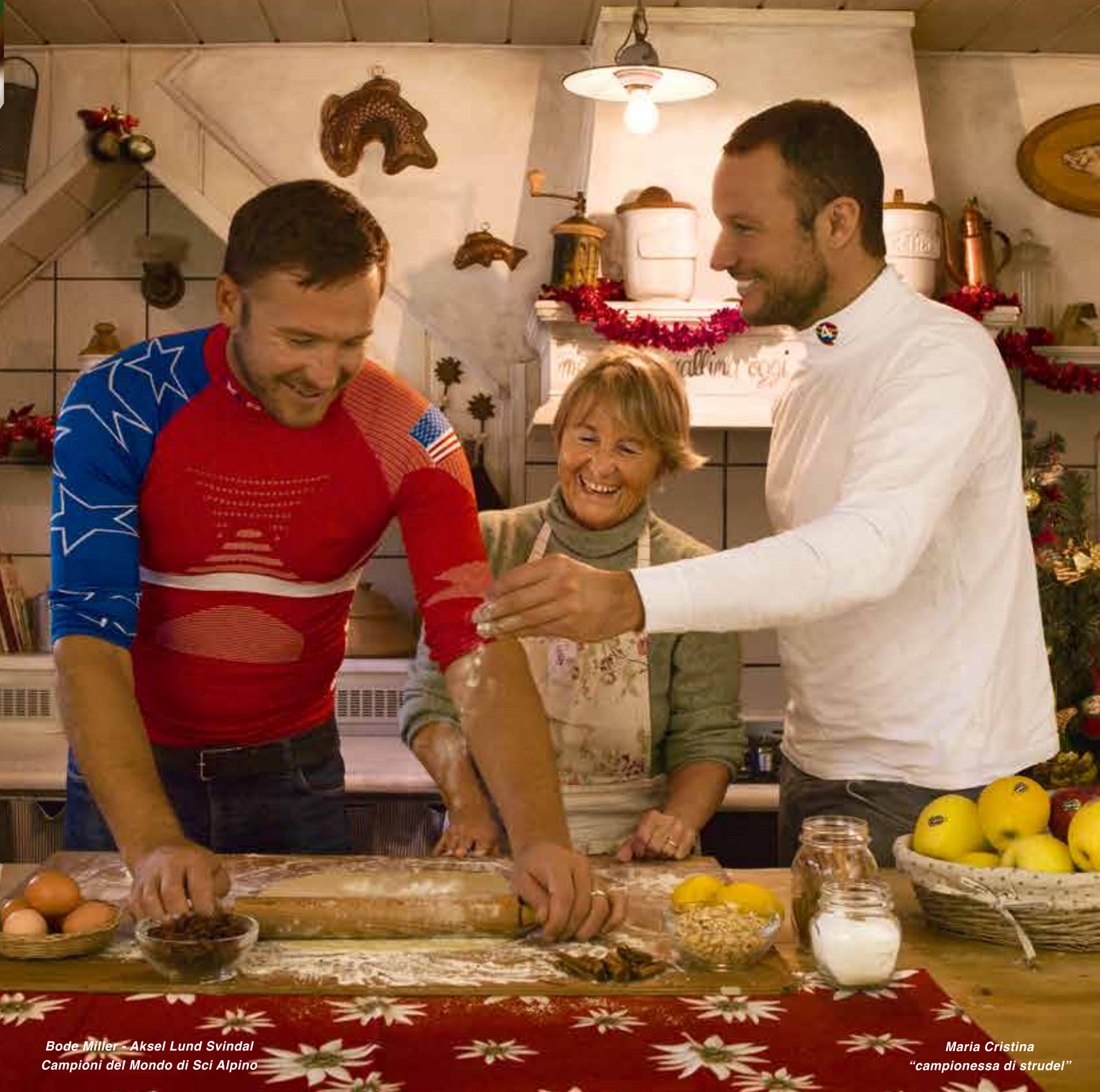
Bode Miller - Aksel Lund Svindal Campioni del Mondo di Sci Alpino